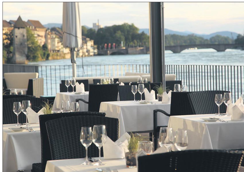
Willkommen auf der MS Bellerive! Links das Restaurant mit weiss gedeckten Tischen; rechts die Lounge mit einladenden Sesseln und Chaiselongues

Vom Stadtpark Rheinfelden her kommend, ein paar Schritte den Rheinuferweg entlang, eine Steintreppe hinauf – und schon sind wir da. Willkommen auf der MS Bellerive! Ein Holzplankendeck, modern möbliert und gegliedert in eine Lounge mit einladenden Sesseln und Chaiselongues, den Apérobereich mit trendigen Stehtischen und Barhockern und schliesslich das eigentliche Restaurant mit seinen weiss gedeckten Tischen. Luftige Sonnensegel und grossflächige Sonnenschirme lassen die Fantasie auf Kreuzfahrt gehen. Von der Reling aus sieht man vier, fünf Meter unter sich den Fluss, zügig und vorwärtsdrängend – und doch treibt es uns nicht weiter, wir dürfen verweilen an diesem einladenden Ort.